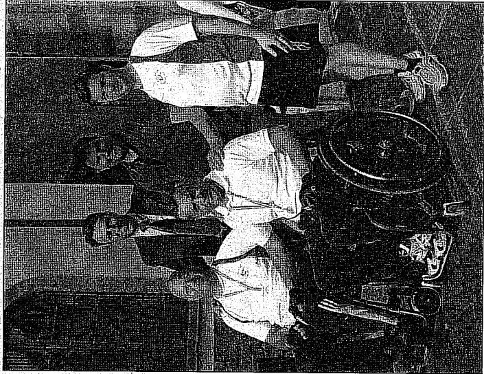
Altopascio per il prossimo Il torneo ha regalato un biliardino della categoria paralimpico all'Unità spinale del Cto di Firenze