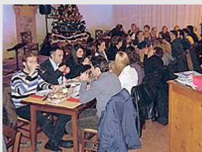
SERATA Un momento della cena